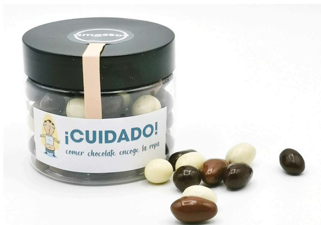
Cacahuets a los tres chocolates

Los chocolates que os presentamos están realizados de forma artesanal por Chocolates Rafael Andreu y las pegatinas se pueden personalizar con el texto de tu evento