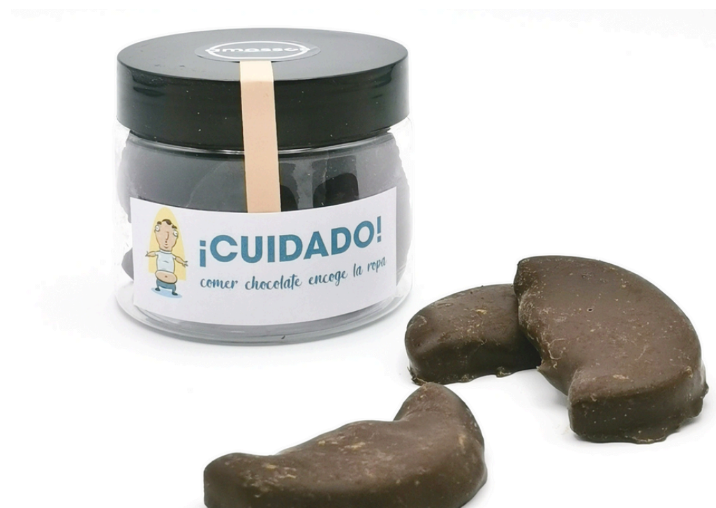
Medias lunas de naranja con chocolate