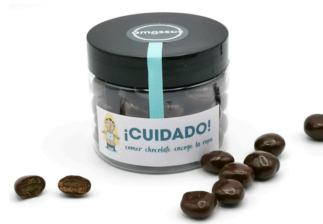
Bolitas de naranja confitada con chocolate